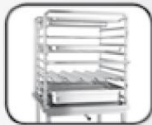
KO 1011R - zavázeční koš