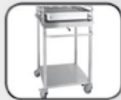
VO 1011 - zavázeční vozík pro manipulaci s KO 1011