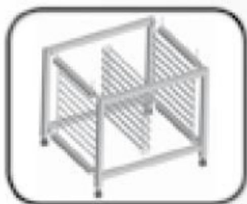
ST 1116 FP - rozkládací podstavec s 16 vsuny GN 1/1