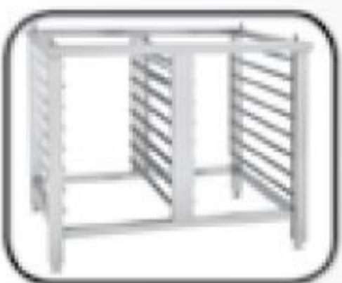
ST 1116 - podstavec s 16 vsuny GN 1/1