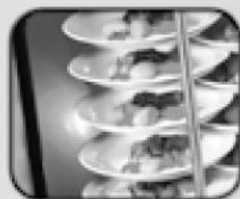
RETIGO Banket System